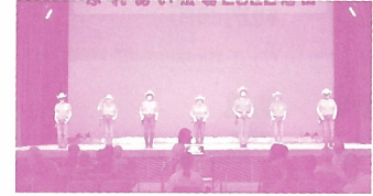
▲令和4年度ふれあい広場の様子。各種福祉団体の活動や事業などに共同募金の一部が活用されています。