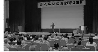
▲令和5年度ふれあい広場の様子。各種福祉団体の活動や事業などに共同募金の一部が活用されています。